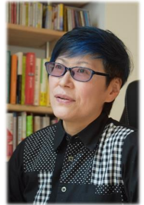
※ 講師はオンラインでの参加となります。